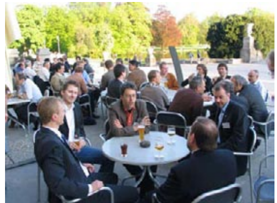
Abbildung 3.02: Ausgelassene Kontaktpflege in der Abendsonne auf der Terrasse des Neuen Rathauses in Hannover