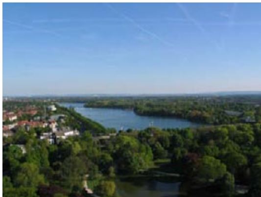
Abbildung 3.01: Blick von der Kuppel des Neuen Rathauses in Hannover auf den Maschsee

Wie bislang jedes Jahr fand der gemeinsame Abend am ersten Tag des Workshops im Gartensaal im Neuen Rathaus statt. Dort wurde das fachliche wie auch persönliche Networking im Gartensaal und auf der Terrasse davor bis in die späten Abendstunden (bzw. frühen Morgenstunden) betrieben, was zu einigen wenigen unbesetzten Stühlen beim ersten Vortrag am nächsten Morgen führte. Aber nach und nach trudelten alle wieder ein, gestärkt vom Frühstücksbüfett und neugierig auf weitere Vorträge. So kam es dann auch, dass der Workshop eigentlich „viel zu früh“ wieder zu Ende war und einige Teilnehmer noch lange nach dem offiziellen Ende in fachliche Gespräche vertieft waren. (Su)