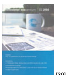
NL 02 2003 [39]