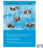
NL 04 2008 [21]