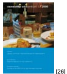
NL 01 2006 [26]