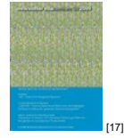
NL 04 2009 [17]