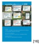
NL 03 2009 [16]