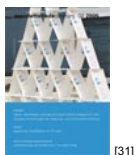
NL 02 2005 [31]