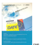
NL 01 2003 [38]