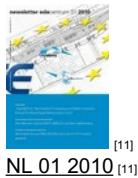
NL 01 2010 [11]