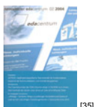
NL 02 2004 [35]