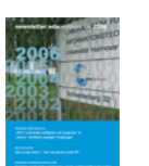
NL 03 2006 [28]