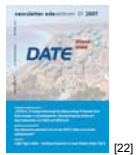
NL 01 2007 [22]