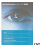
NL 03 2004 [36]