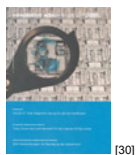
NL 01 2005 [30]