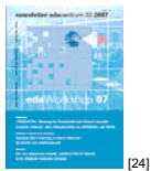
NL 03 2007 [24]