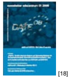
NL 01 2008 [18]