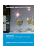
NL 04 2006 [29]