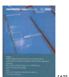
NL 02 2002 [43]