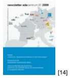
NL 01 2009 [14]