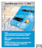
NL 02 2007 [23]