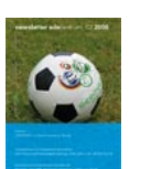
NL 02 2006 [27]