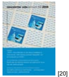
NL 03 2008 [20]