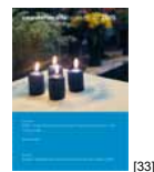
NL 04 2005 [33]