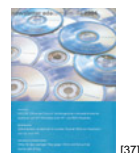
NL 04 2004 [37]