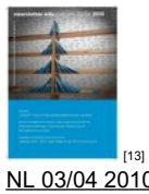
NL 03/04 2010 [13]