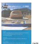
NL 03 2003 [40]