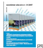
NL 04 2007 [25]