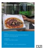
NL 03 2005 [32]