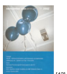
NL 01 2002 [42]