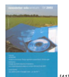
NL 04 2003 [41]