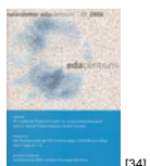
NL 01 2004 [34]