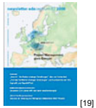
NL 02 2008 [19]