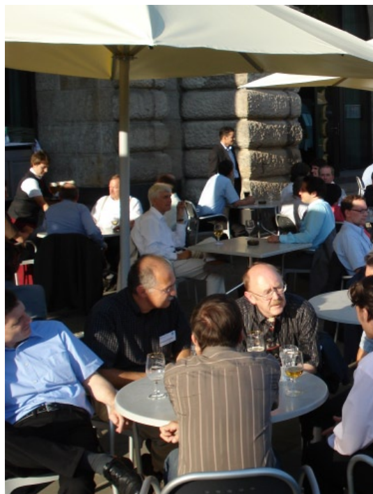
Abbildung 3.01: Ausgelassene Kontaktpflege in der Abendsonne auf