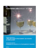
NL 04 2006 [29]