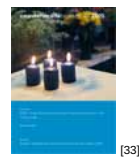
NL 04 2005 [33]