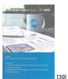
NL 02 2003 [39]