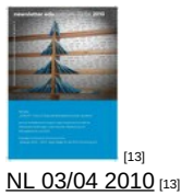
NL 03/04 2010 [13]