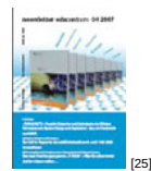
NL 04 2007 [25]