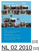
NL 02 2010 [12]