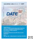
NL 01 2007 [22]