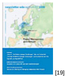
NL 02 2008 [19]