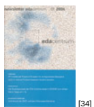
NL 01 2004 [34]