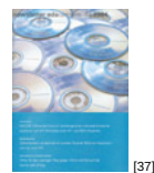
NL 04 2004 [37]