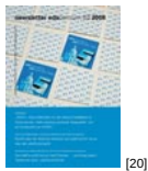
NL 03 2008 [20]