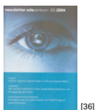
NL 03 2004 [36]