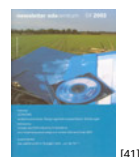
NL 04 2003 [41]