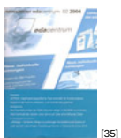
NL 02 2004 [35]