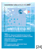
NL 03 2007 [24]