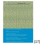
NL 04 2009 [17]