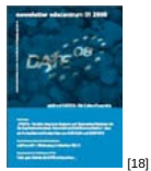
NL 01 2008 [18]