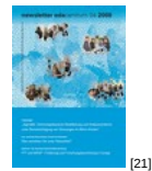
NL 04 2008 [21]