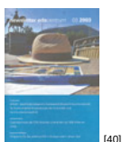
NL 03 2003 [40]