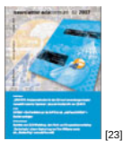
NL 02 2007 [23]