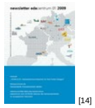
NL 01 2009 [14]