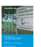
NL 03 2006 [28]