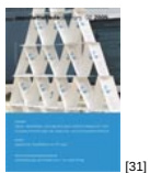
NL 02 2005 [31]