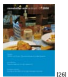
NL 01 2006 [26]