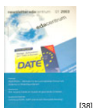
NL 01 2003 [38]