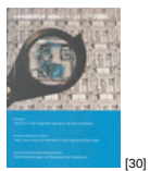
NL 01 2005 [30]