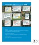
NL 03 2009 [16]