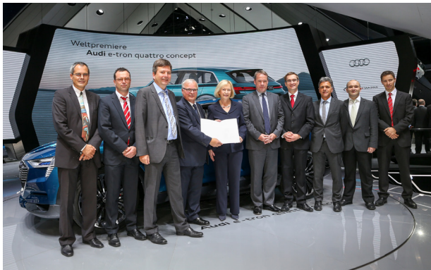
Übergabe des Förderbescheides an das Projekt autoSWIFT durch Prof. Dr. Johanna Wanka, Bundesministerin für Bildung und Forschung, auf der IAA am 22.9.2015

In autoSWIFT werden unter Beteiligung aller relevanten Entwicklungspartner die Grundlagen für eine gemeinsame Technologie- und Applikationsbewertung von Fahrzeugkomponenten entwickelt, bewertet und anhand von innovativen Demonstratoren exemplarisch verifiziert. Es werden zudem die methodischen Grundlagen für eine verzahnte entwicklungspartner- und domänenübergreifende Entwicklung von Fahrzeugkomponenten (OEM ↔ Tier n) entwickelt und bewertet.