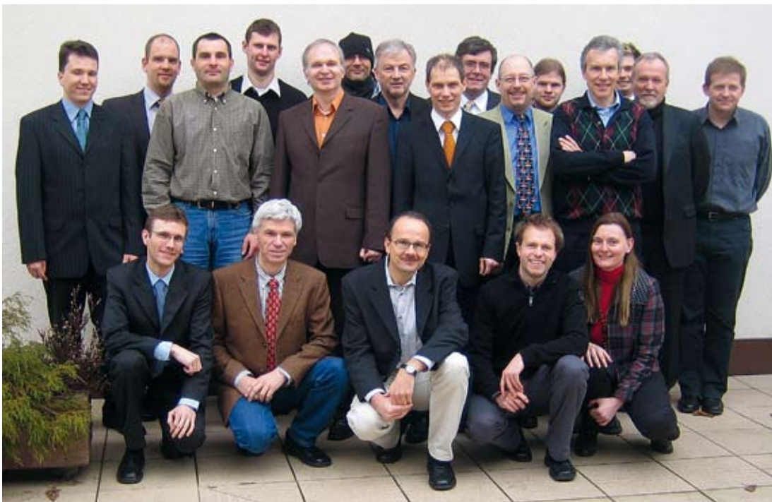
Abbildung 1.06: Teilnehmer des Herkules Reviewmeetings am 28. Januar 2009 in Freiburg