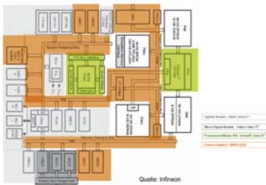
Abbildung 1.02: Formale Verifikation innerhalb unterschiedlicher Förderprojekte

Technisches Ziel von HERKULES ist es, einen Großteil der bei der Verifikation dieser Kommunikationsstruktur anfallenden Aufgaben formal durchzuführen. Auch hier wird wieder unter maximaler Nutzung der VALSE- und VALSE-XT-Ergebnisse versucht, höchste Qualität mit überlegener Produktivität zu koppeln und diese Qualität zu einem Produktvorteil zu machen. Sicherheitshalber sei betont: Für die Verifikation des Gesamtsystemkonzepts wird die simulationsbasierte Verifikation weiterhin benötigt. Sie wird aber durch die VALSE- und HERKULES-Techniken von einer Fülle von Aufgaben der Codeverifikation entlastet, die so weit besser bewältigt werden können.